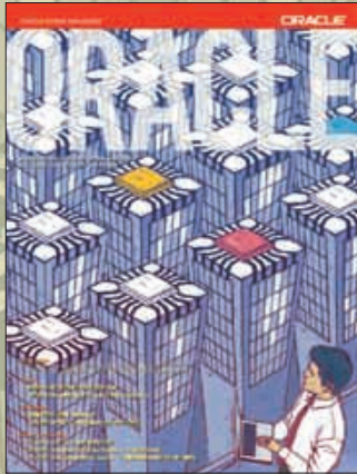
2003 Number 3 Volume 36 Autumn