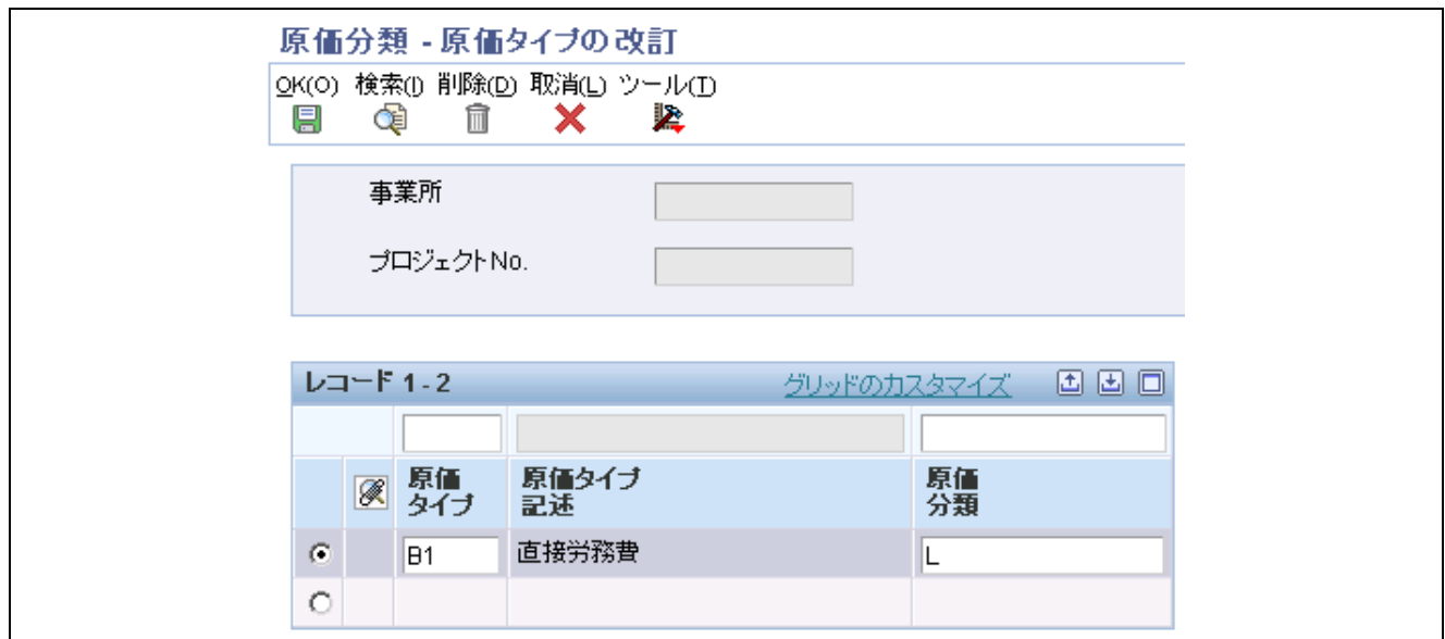
「原価タイプの改訂」フォーム