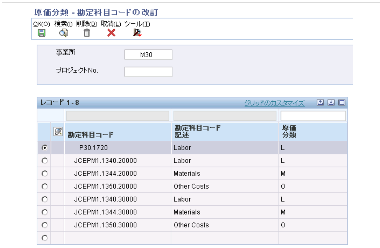
「勘定科目コードの改訂」フォーム

「勘定科目コードの改訂」フォームを表示するには、原価分類プログラム(P31P301)の処理オプションを設定して、原価タイプ別ではなく勘定科目別にプログラムを表示する必要があります。